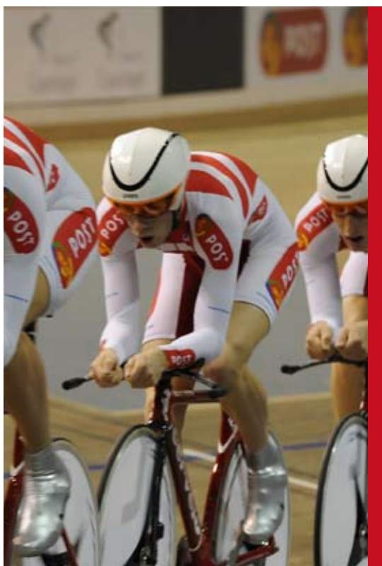
World Cup bane-cykling afvikles i Ballerup Arena i februar 2009.

Se oversigt over danskere på internationale poster på side 7-8.