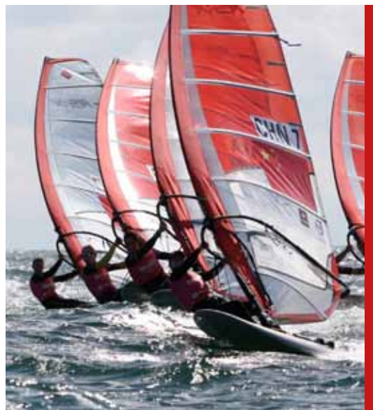
Fuld fart over feltet ved VM i RS:X