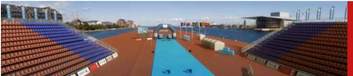
Finalerne bliver placeret i en dramatisk kulisse over vandet ud for Operahuset.

Danmark præsenterer sit endelige bud for FITA i november i år.