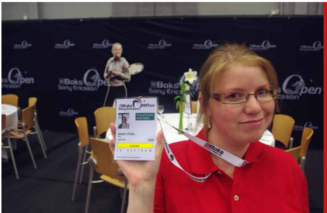
Frivillig fra e-boks Sony Ericsson Open 2010

Det kan være en ordentlig mundfuld at arrangere en stor event, og alene rekruttering af frivillige samt planlægning og kommunikation med dem kan være en kæmpe opgave, som ofte kræver langt større ressourcer end umiddelbart forventet.