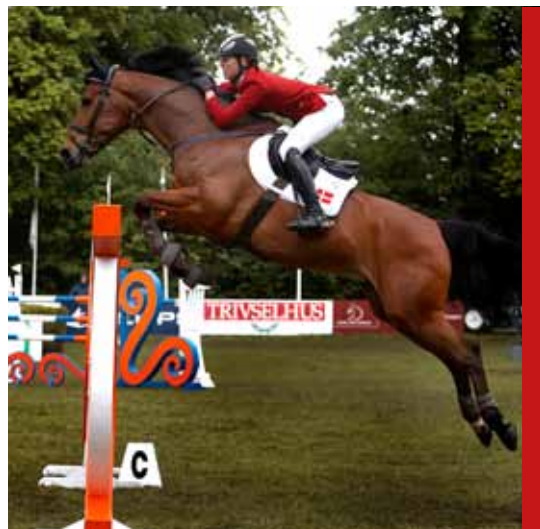
Danmark byder på EM Dressur og Spring 2013

VM 29'er og EM 49'er 2013 (Begge sejlsport) World Cup Trampolin 2011 EM Bordtennis 2012