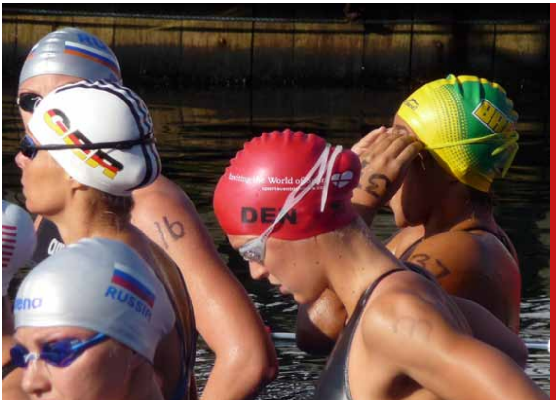
Sportsåret 2009 benyttede enhver lejlighed til at sætte sit præg på de mere end 50 internationale begivenheder i Danmark. Her ses Sportsåret på den særlige world-cup badehætte ved FINA world cup'en i 10 km maratonsvømning i de københavnske kanaler i slutningen af august.

Sport Event Denmark har netop i samarbejde med VisitDenmark, DIF og Wonderful Copenhagen offentliggjort en evaluering af IOC-kongressen, som du kan læse mere om i eventportrættet . Og om få uger offentliggør vi evalueringerne fra VM i hhv. brydning og taekwondo.