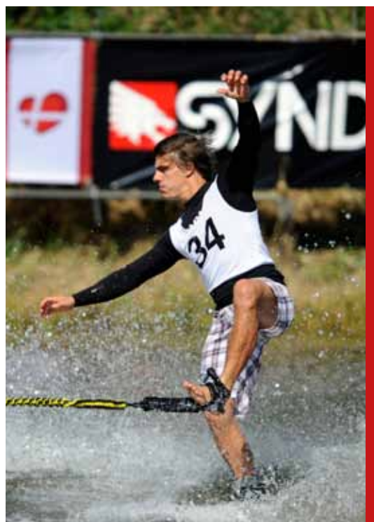
Dansk Vandski Forbund, Vallensbæk Vandski Klub og Vallensbæk Sø dannede i dagene 19. - 23. august 2009 rammerne om eventen, hvor 20 nationer deltog med i alt 230 vandskiløbere og ledere.

Analysen indeholder 2 separate målinger. Dels en effektmåling blandt deltagere/ledere og tilskuere, dels en frivillighedsundersøgelse blandt de 75 frivillige hjælpere.