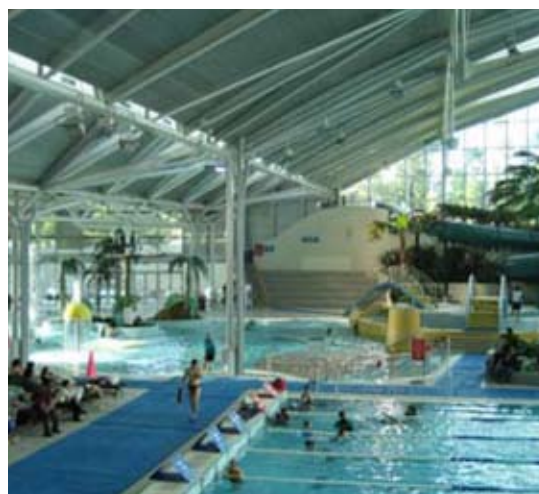
Et eksempel på hverdagsbrug af et stort opvisningsanlæg. Sydneys olympiske svømmeanlæg rummer i dag også et badeland.

Læs program, information om oplægsholdere og tilmelding på www.idan.dk .