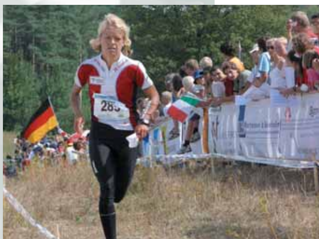
Dansk Orienterings-Forbund modtog Idrætsfondens Initiativpris 2006.

Dansk Orienterings-Forbund er blevet hædret med Idrætsfondens Initiativpris 2006 for forbundets store og intense arbejde i forbindelse med afviklingen af VM i orientering i august 2006 i Århus.