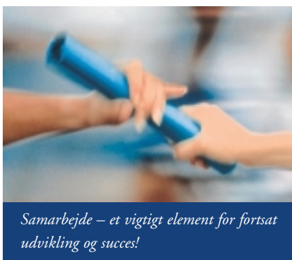
Samarbejde – et vigtigt element for fortsat udvikling og succes!

Det relativt nye og uformelle netværk for organisationer/enheder, der arbejder med internationale sportsbegivenheder, har afholdt en række møder de sidste 4 måneder.