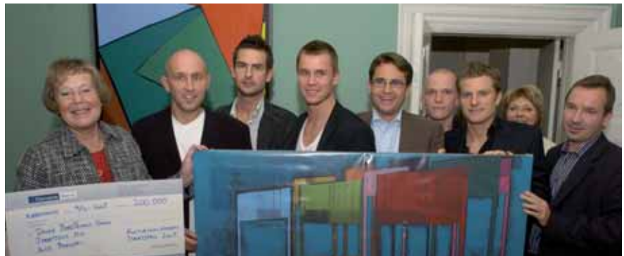
Kulturministeriet belønner specialforbundsarbejde.

projekter over de næste to år, landsholds-satsning samt arbejde med sub-eliten og sikring af "spillerfødekæden".