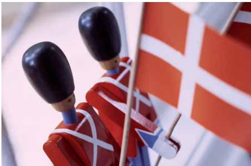
VisitDenmark stiler billeder til rådighed.

Se databasen samt de nærmere vilkår for brug af billeder på hjemmesiden: http://billeder.visitdenmark.com