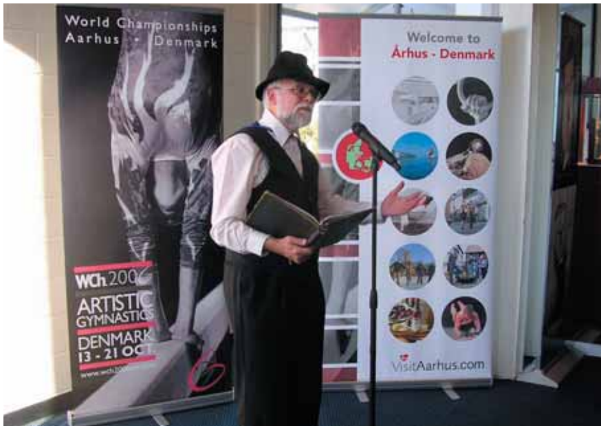
Oplæsning af HC Andersen-eventyr i forbindelse med VM i gymnastik 2005.