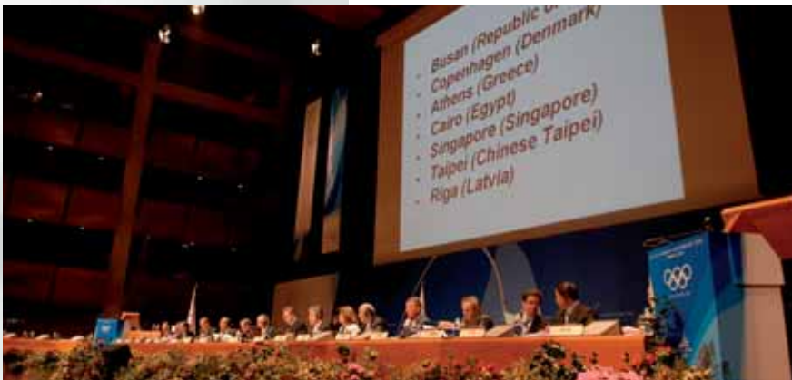
Danmark vandt sessionen med 59 stemmer mod 40 til Cairo.

Event'en udgives 2-3 gange årligt af Idrætsfonden Danmark, hvis hovedformål er at tilføre Danmark flere større internationale idrætsarrangementer og idrætskongresser, der bl.a. kan øge den udenlandske turisme i Danmark og styrke Danmarks image i ind- og udland.