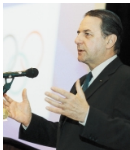
IOC-præsident Jacques Rogge holdt et blændende og meget inspirerende foredrag.