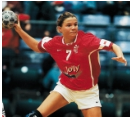
EM kvindehåndbold 2002 har målsætningen om at blive det bedste EM til dato